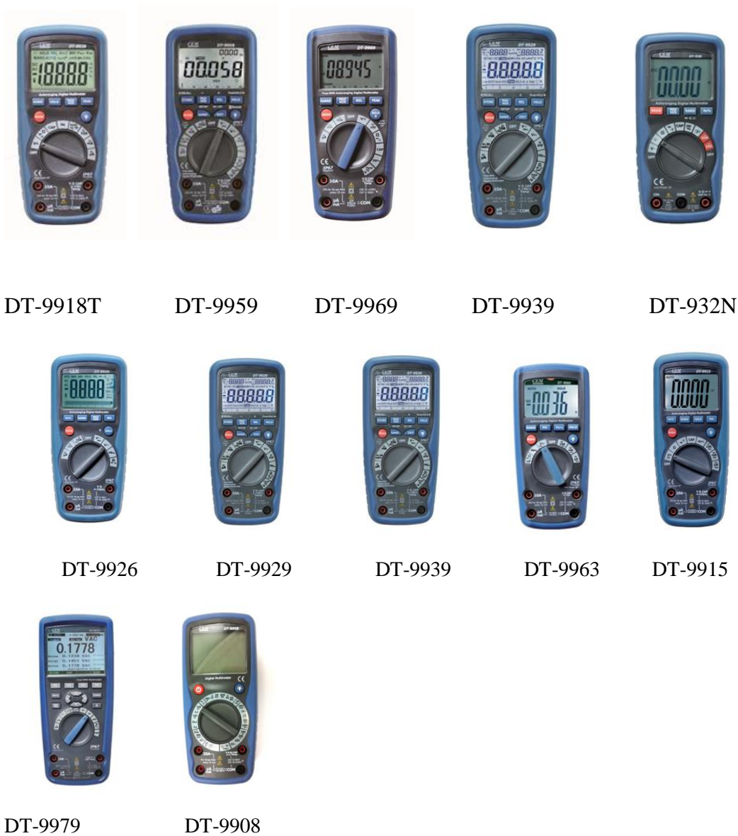
Рисунок 1. Фотографии общего вида мультиметров цифровых серии DT